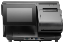
Rückseite mit 7 Zoll Kundenmonitor