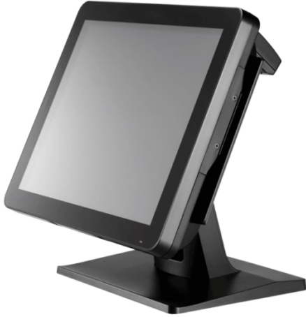
Abbildung zeigt Zusatzausstattung