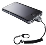
Orderman mit Sicherheitskordel