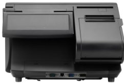
Rückseite mit 2-zeiligem Kundendisplay