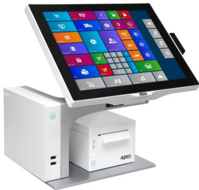
Weiß, mit Bondrucker

Die stylische Design-Kasse mit Farb- und Serviceoption: