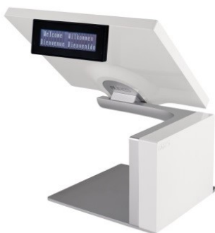
weiß mit Kundendisplay

Kellnerschloss und Barcode-Scanner sind seitlich am Bildschirm montiert; wahlweise links oder rechts.