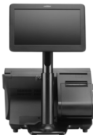
Rückseite mit 7 Zoll Kundenmonitor auf Säule (drehbar)