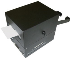
Rückseite (Ticketeinzug); Vorderseite mit Auffangschale.